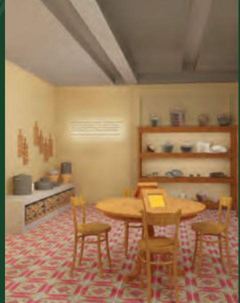
ஓவியர் ஒருவரது கைவண்ணத்தில் செட்டி சமையலறை

செட்டி மலாக்கா சமையல்கலை, இந்திய, மலாய் பாணிகளின் அற்புதமானதொரு கலவையாகும். ஒவ்வொரு வைபவத்திற்கும் பலவித உணவு வகைகள் உள்ளன. பாரம்பரிய இந்தியச் சுவைப்பொருட்களோடு பிளாச்சான் (இறால் களி), செராய் (சிட்ரோனெல்லா), வெங்குவாஸ் (காட்டு இஞ்சி), பாண்டான் இலை, தேங்காய்ப் பால் சேர்த்து தனித்துவமிக்க செட்டி பதார்த்தங்கள் சமைக்கப்படுகின்றன.