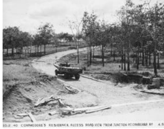
கேன்பரா சாலையிலிருந்து முன்னாள் அட்மிரால்டி ஹவுஸ் கட்டடத்திற்கு இட்டுச்செல்லும் நெல்சன் சாலை (இப்போது ஓல்டு நெல்சன் சாலை), 1940