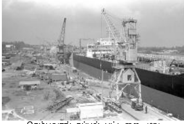
செம்பவாங் கப்பல் பட்டறை, 1971 தகவல், கலைகள் அமைச்சின் திரட்டு, சிங்கப்பூர் தேசிய ஆவணக் காப்பகத்திற்கு நன்றி