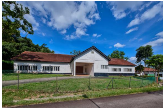
ஜிப்ரால்டர் கிரசன்ட்டில் உள்ள தனித்துவமான ஒரு கட்டடம் ஜப்பானிய தியேட்டர் அல்லது கப்பல் பட்டறை தியேட்டர். இது, ஜப்பானியர் ஆக்கிரமிப்பின்போது கட்டப்பட்டது. பிற்பாடு, இரண்டாம் உலகப் போருக்குப் பிறகு, இங்கு நாடகங்கள் அரங்கேற்றப்பட்டன, 2021 தேசிய மரபுடைமைக் கழகத்திற்கு நன்றி