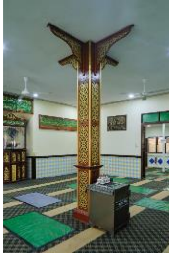
மஸ்ஜித் பெடம்படன் மலாயு செம்பவாங் பள்ளிவாசலின் மையப்பகுதியில் அமைந்துள்ள தியாங் செரி, 2021 தேசிய மரபுடைமைக் கழகத்திற்கு நன்றி