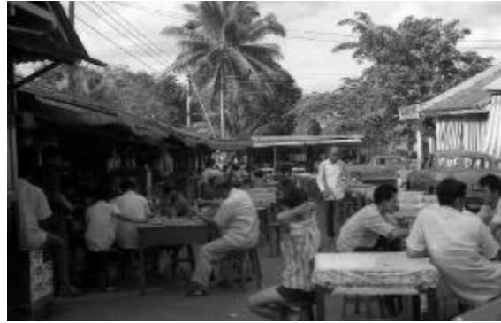
செம்பவாங் பேட்டியோ, 1967