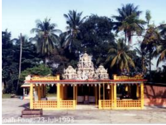
முன்பு கேன்பரா சாலையில் அமைந்திருந்த புனித மரம் ஸ்ரீ பாலசுப்பிரமணியர் கோவில், 1993 லோ குவா : பொங்குக்கு நன்றி

இன்று, செம்பவாங்கிலும் யீஷூனிலும் உள்ள இந்து மக்களுக்கு புனித மரம் ஸ்ரீ பாலசுப்பிரமணியர் கோவில் தொடர்ந்து சேவையாற்றி வருகிறது. முருகப் பெருமானுக்கும் தெய்வானைக்கும் திருமணமான நாளை முன்னிட்டு, ஆண்டுதோறும் பங்குனி உத்திரத் திருவிழா இங்கு பிரம்மாண்டமாக நடைபெறுகிறது. தேர், காவடி ஊர்வலங்களில் பக்தர்கள் பலர் பங்கெடுப்பார்கள்.