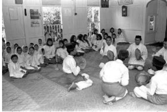
பள்ளிவாசலில் நடைபெற்ற ஹத்ரா (கை முரசு) நிகழ்ச்சி, 1966 தகவல், கலைகள் அமைச்சின் திரட்டு, சிங்கப்பூர் தேசிய ஆவணக் காப்பகத்திற்கு நன்றி