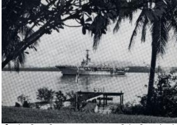
கடற்படை அதிகாரிகள் பியூலியூ அணைகரையில் ஹெச்எம்எஸ் அல்பியோன் விமானந்தாங்கி கப்பலுக்குத் தலைவணங்குகின்றனர், 1965