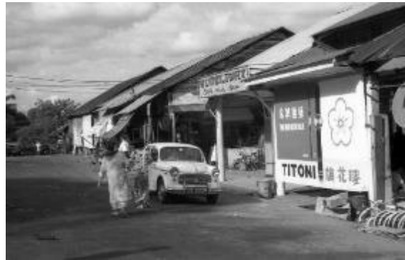
முன்னாள் செம்பவாங் வில்லேஜில் இருந்த கடைகளும் மதுபானக் கடைகளும், 1967 டேவிட் ஏயர்ஸ்-க்கு நன்றி