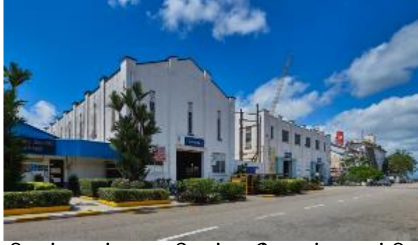
செம்பகார்ப் மரீன் அட்மிரால்டி பட்டறையிலுள்ள போருக்கு முந்திய காலத்து கட்டடங்கள், 2021 தேசிய மரபுடைமைக் கழகத்திற்கு நன்றி