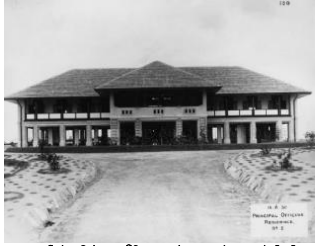
தலைமை அதிகாரி ஒருவரின் இந்த வீடு, கடற்படைத் தளத்திலிருந்து பெரிய வீடுகளில் ஒன்றாகும், 1930 யுனைடெட் கிங்டம் தேசிய ஆவணக் காப்பகத்திற்கு நன்றி