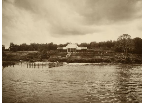
நீச்சல் பகாருடன் (மலாய் மொழியில் “வேலி” என்று அர்த்தம்) பியூலியூ ஹவுஸின் தோற்றம், 1920கள்

1981 முதல், பியூலியூ ஹவுஸ் ஓர் உணவகமாகப் பயன்பட்டு வருகிறது. 2005ல், இந்தக் கட்டடம் பழமை பாதுகாப்புக் கட்டடமாகத் தகுதி பெற்றது.