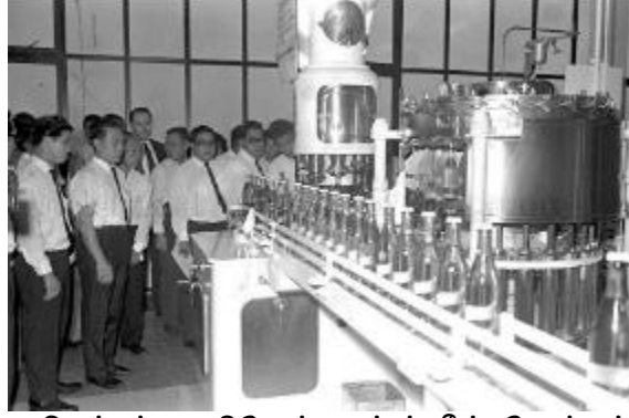
செமாங்காட் ஆயர் என்றறியப்பட்ட ஃபிரேசர் அண்ட் நீவ் போத்தல்நீர் தொழிற்சாலை, 1967 தகவல், கலைகள் அமைச்சின் திரட்டு, சிங்கப்பூர் தேசிய ஆவணக் காப்பகத்திற்கு நன்றி