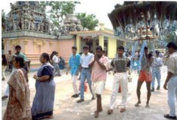
கோவில் ஏற்பாடு செய்யும் வருடாந்தர பங்குனி உத்திரத் திருவிழாவில் காவடி ஊர்வலத்தில் பங்குபெறும் பக்தர்கள், 1990 தகவல், கலைகள் அமைச்சின் திரட்டு, சிங்கப்பூர் தேசிய ஆவணக் காப்பகத்திற்கு நன்றி