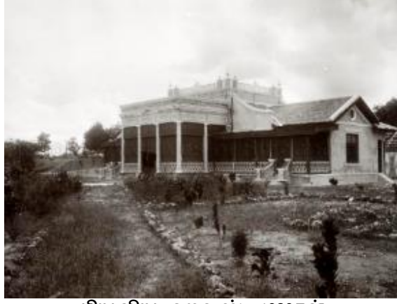
பியூலியூ ஹவுஸ், 1920கள்