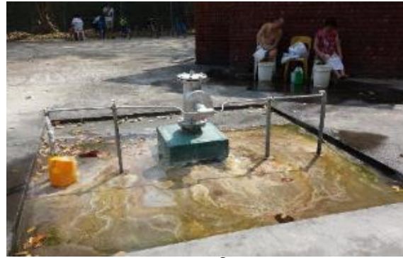
2014ல் வெந்நீர் ஊற்று தேசிய மரபுடைமைக் கழகத்திற்கு நன்றி