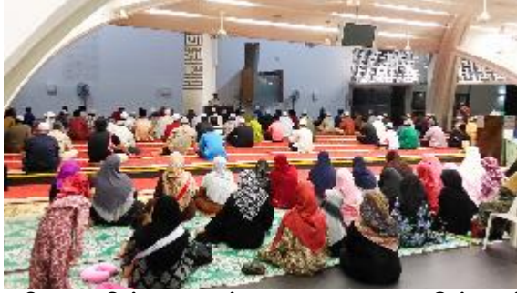
மஸ்ஜித் அஸ்யஃபா பள்ளிவாசலில் மாதாந்தர சமய உரையின் (ஸ்யாராஹான் புலானான்) பங்கேற்பாளர்கள், 2014 மஸ்ஜித் அஸ்யஃபாவுக்கு நன்றி