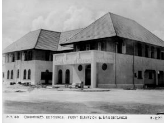
முன்னாள் அட்மிரால்டி ஹவுஸ் கட்டடத்தின் முன்தோற்றம், அதன் சமச்சீரான வடிவமைப்பைக் காட்டுகிறது, 1940