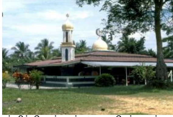
மஸ்ஜித் பெடம்படன் மலாயு செம்பவாங், 1986

பள்ளிவாசல் கட்டடத்திற்குப் பக்கத்தில் ஒரு பெரிய ரப்பர் மரம் இருக்கிறது. இந்த மரத்தின் வயது குறைந்தது ஒரு நூற்றாண்டு என நம்பப்படுகிறது. இதுவே சிங்கப்பூரின் ஆகப் பழைய ரப்பர் மரமாக இருக்கக்கூடும். இந்தப் பள்ளிவாசல், இன்றுவரை செம்பவாங்கில் வசிக்கும் முஸ்லிம் சமூகத்தின் முக்கியமான சமய, சமூக இடமாக விளங்கி வருகிறது.