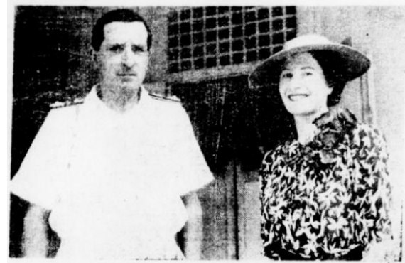
வீட்டின் முதல் குடியிருப்பாளர்களான ரியர் அட்மிரல் எர்னஸ்ட் ஜான் ஸ்பூனரும் அவரது மனைவி மேகன் ஃபாஸ்டரும், 1941 மலாயா ட்ரிபியூனின் 2 செப்டம்பர் 1941 பதிப்பிலிருந்து எடுக்கப்பட்ட படம்