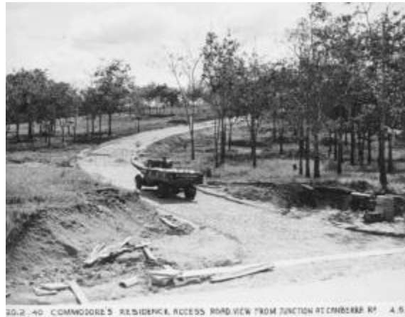
Nelson Road (sekarang Old Nelson Road), yang menuju ke bekas Rumah Admiralti dari Canberra Road, 1940