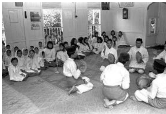
Persembahan Hadrah (kompang) di masjid, pada tahun 1966 Kementerian Perhubungan dan Koleksi Kesenian, ihsan Arkib Negara Singapura