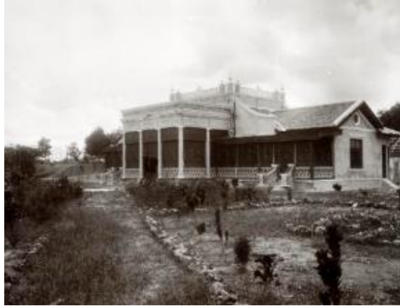
Rumah Beaulieu, 1920-an