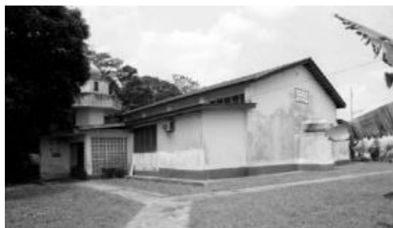
Bekas Masjid Pangkalan Tentera Laut, yang terletak di persimpangan Canberra Road dan bekas Delhi Road, 1986

Selain menyediakan ruang untuk solat dan pelajaran agama, Masjid Assyafaah juga wadah kepada masyarakat Sembawang untuk mengadakan majlis dan kegiatan seperti Hari Keluarga tahunan dan pengedaran bantuan makanan kepada keluarga yang memerlukan.