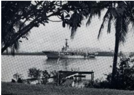
Pegawai tentera laut di Jeti Beaulieu memberi tabik hormat kepada kapal induk pesawat udara HMS Albion , 1965