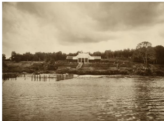
Pandangan Rumah Beaulieu dengan kawasan renang di pagar, tahun 1920-an

Sejak tahun 1981, Rumah Beaulieu pernah berfungsi sebagai restoran dan pada tahun 2005, bangunan ini diberi status pemuliharaan.