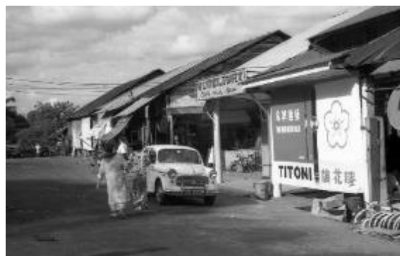
Kedai dan bar di bekas Desa Sembawang, 1967