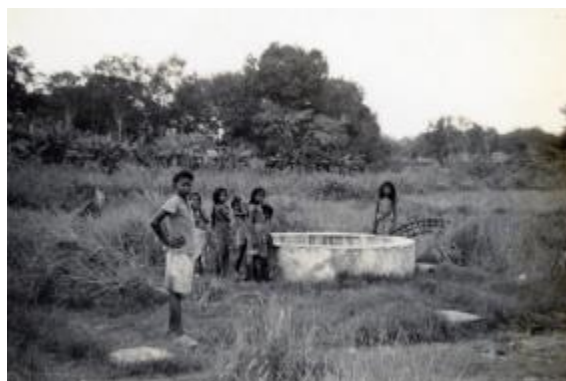
Kanak-kanak di perigi di kawasan sumber air panas, 1947

Berikutan rayuan dari masyarakat untuk memelihara kawasan mata air panas kerana nilai saintifik dan sejarahnya, pemerintah membuka kawasan mata air panas itu kepada orang ramai dan kemudian memajukan kawasan itu menjadi Taman Mata Air Panas Sembawang, yang dibuka pada Januari 2020.