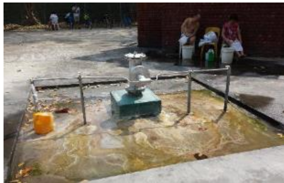
Mata air panas pada tahun 2014 Ihsan Lembaga Warisan Negara