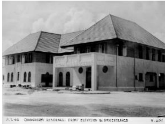
Bahagian depan Bekas Rumah Admiralty, menunjukkan reka bentuknya yang tidak simetri, pada tahun 1940