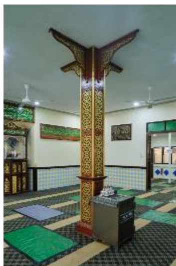
Tiang seri berada di tengah dalam Masjid Petempatan Melayu Sembawang, 2021