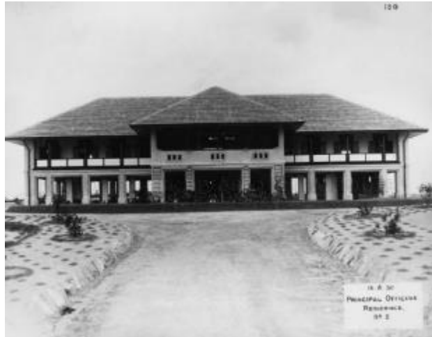
Kediaman pegawai utama, yang merupakan salah satu rumah yang lebih besar di pangkalan tentera laut, 1930