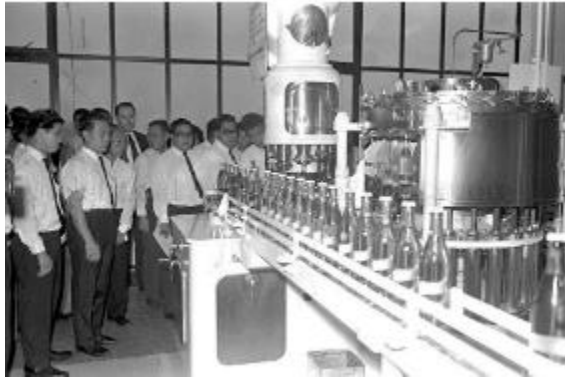
Kilang pembotolan Fraser & Neave, yang dikenali sebagai Semangat Ayer, 1967 Kementerian Perhubungan dan Koleksi Kesenian, ihsan Arkib Negara Singapura