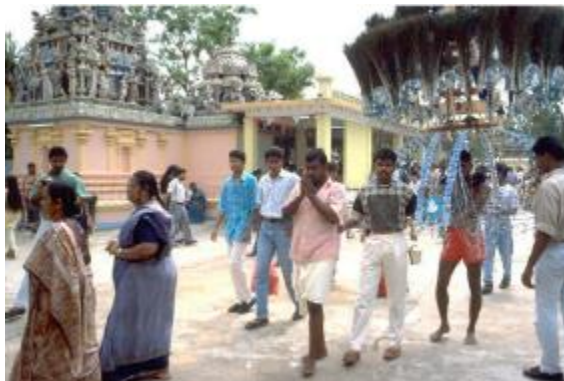
Penganut dalam perarakan semasa pesta Panguni Uthiram tahunan yang dianjurkan oleh kuil, 1990 Kementerian Perhubungan dan Koleksi Kesenian, ihsan Arkib Negara Singapura