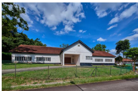
Bangunan unik di sepanjang Gibraltar Crescent yang dikenali sebagai Teater Jepun atau Teater Limbungan, yang dibina semasa Pendudukan Jepun dan kemudian digunakan untuk penganjuran persembahan drama selepas Perang Dunia II, 2021