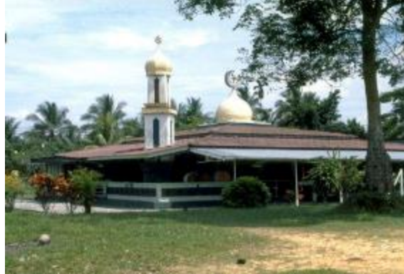
Masjid Petempatan Melayu Sembawang, pada tahun 1986

Di sebelah bangunan masjid terdapat pokok getah besar, yang dipercayai berusia sekurang-kurangnya satu abad dan mungkin merupakan pokok getah tertua yang masih hidup di Singapura. Hari ini, masjid ini terus berfungsi sebagai wadah kegiatan agama dan sosial yang penting bagi masyarakat Islam di Sembawang.