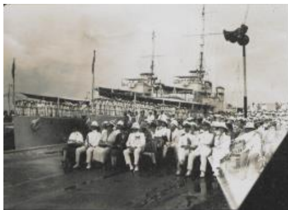
Tetamu di pembukaan rasmi pangkalan tentera laut, 1938

Hari ini, limbungan kapal tetap itu menjadi bahagian penting dalam industri marin Singapura. Limbungan Kering King George VI, serta bangunan bengkel sebelum perang, terus digunakan. Limbungan kapal itu juga menempatkan tempat-tempat keagamaan, termasuk surau (ruang solat) untuk tenaga kerja Islam dan Kuil Sree Madurai Veeran Kaliyamman, sebuah kuil Hindu yang didirikan pada tahun 1970-an di bawah pohon suci.