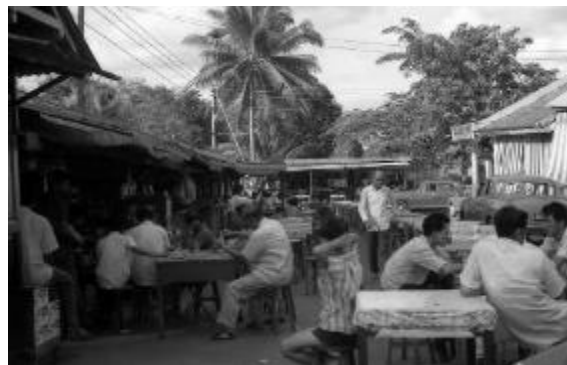
Patio Sembawang, 1967 Ihsan David Ayres