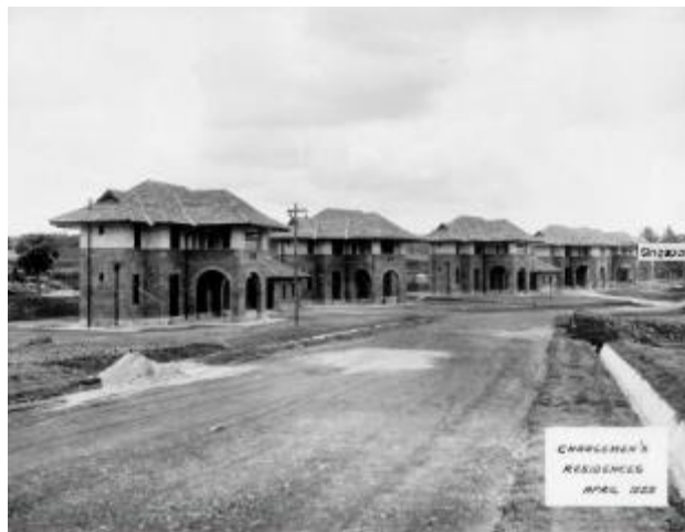
Kediaman Jurujaga, yang menunjukkan pengaruh aliran seni dan kemahiran seni dalam reka bentuk tersebut, 1929