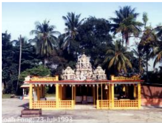
Kuil Holy Tree Sri Balasubramaniar di bekas lokasi di Canberra Road, 1993

Hari ini, Kuil Holy Tree Sri Balasubramaniar terus dikunjungi penduduk beragama Hindu Sembawang dan Yishun. Ia juga terkenal dengan penganjuran Panguni Uthiram, pesta tahunan di mana para penganut mengambil bahagian dalam perarakan kenderaan dan berjalan untuk memperingati pernikahan Tuhan Murugan dan isterinya, Deivanai.