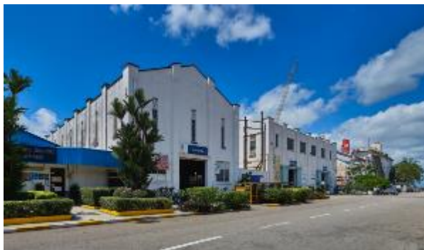
Bangunan bengkel pra-perang di Limbungan Admiralti Marin Sembcorp, 2021