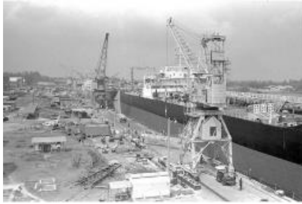
Limbungan Sembawang, 1971