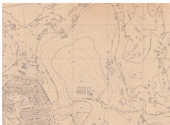
宏茂桥重建发展之前的地形图，中间的小山丘是宏茂桥镇西公园的所在地，1970年

对宏茂桥居民来说，这座公园不仅是休闲和运动的好去处，也是观赏蝴蝶飞舞的场所。1987年，哥本峇鲁观鸟俱乐部在公园西麓成立，可悬挂上千个鸟笼，是本地最大的赏鸟地点。