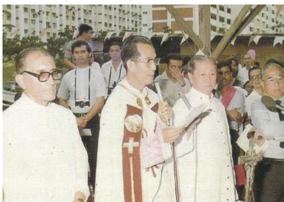
耶稣君王堂举行奠基仪式，1981年