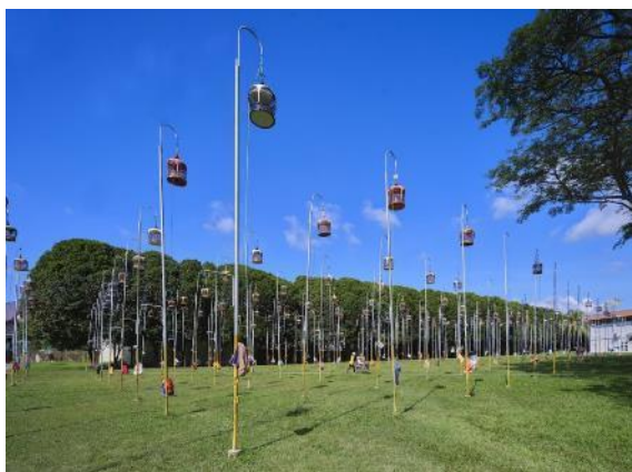
哥本峇鲁观鸟俱乐部的赏鸟广场，2023年