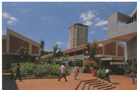
宏茂桥市镇中心，远处可看到被誉为“贵宾楼”的第710座组屋，1981年

多年来，市镇中心经历了多轮翻新，并引进新的发展项目，包括2007年启用的宏茂桥城，连接着地铁站和巴士转换站，交通十分方便。这些翻新项目旨在确保市镇中心满足居民不断变化的需要。