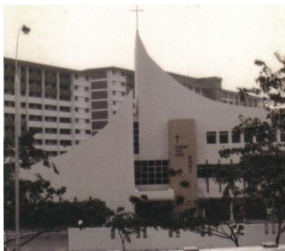
耶稣君王堂开幕时的建筑外观，1982年