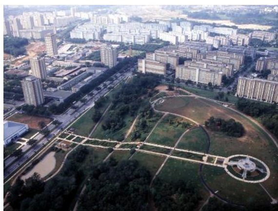
宏茂桥镇西公园的鸟瞰图，1982年