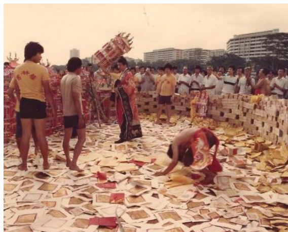
金英堂在新址举行祭拜仪式，1983年