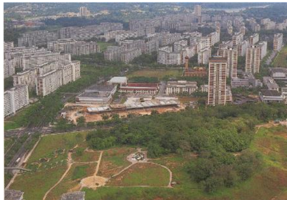
宏茂桥镇东公园的鸟瞰图，1981年