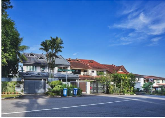
教师园内的孟诗阿都拉道，纪念撰写新加坡建国历史的马来亚作家，2023年