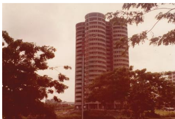
施工中的第259座组屋，1981年