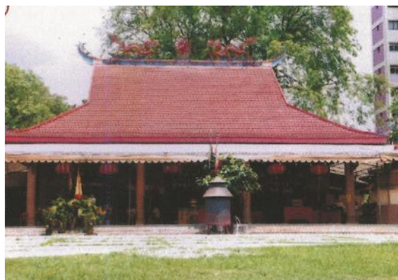
位于宏茂桥1道的联合庙原貌，1983年