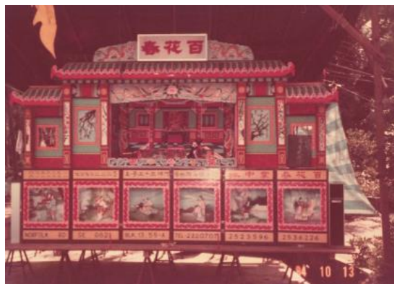
六巡村的凤山堂在节日期间办木偶戏，年份不详 凤山堂进法殿全盛宫提供