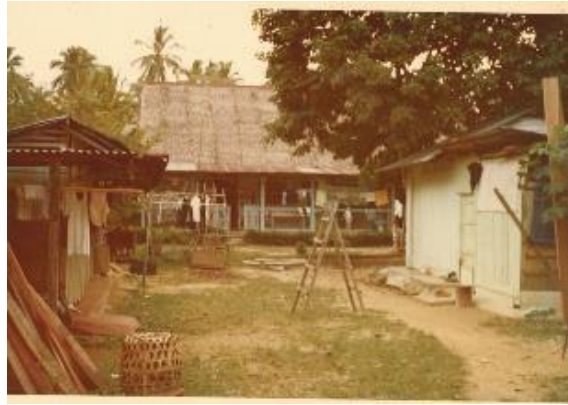
静山的甘榜屋，年份不详