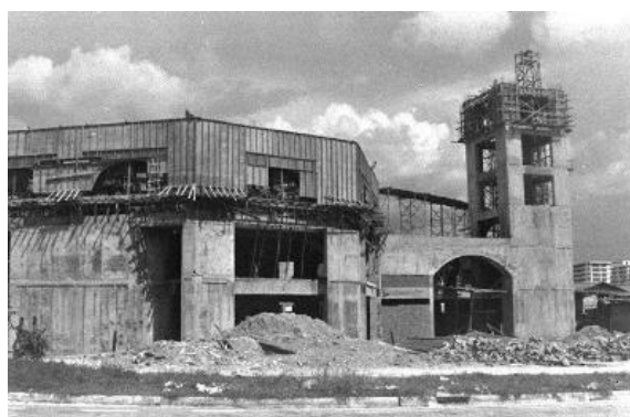
施工中的阿尔慕达金回教堂，1979年