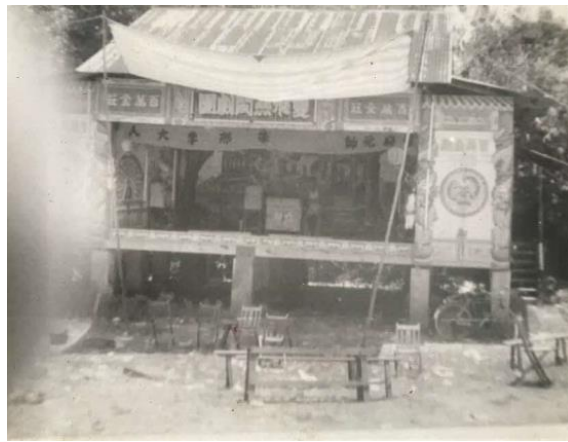
榕林宫在旧静山路的戏台，年份不详

龙山岩斗母宫成立于1950年代，由来自福建永春的周氏华侨创建，坐落在旧静山路，与现今的宏茂桥3道平行。这座庙供奉法主公，以神明灵验和测“真字”而闻名。