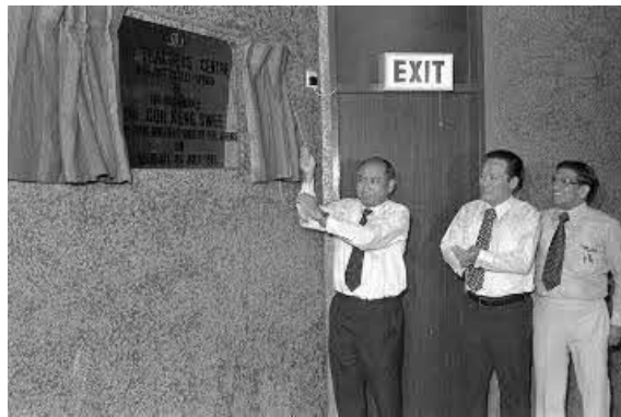
时任副总理兼国防部长吴庆瑞在教师中心开幕礼上揭开纪念牌匾，1975年 新闻及艺术部收藏，新加坡国家档案馆提供

照片取自杨明照的《教师园汇报》，教师论坛第一期（1968年4月至5月）（新加坡：新加坡教师工会，1968年），第12页。（来自新加坡国家图书馆，图书编号 RCLOS 331.88113711 TF）。