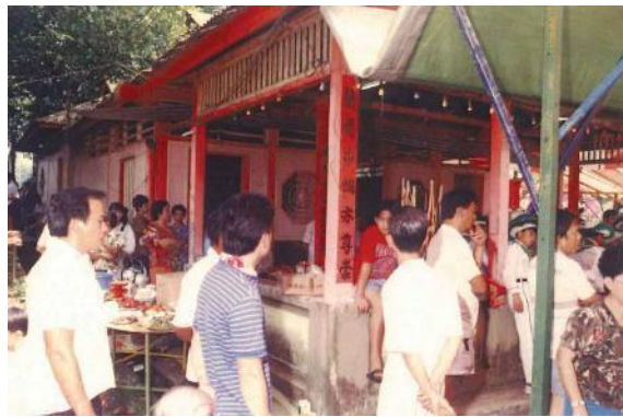
龙须岩金水馆迁庙仪式，1989年