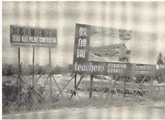
竖立在教师园工地的销售广告牌，1968年