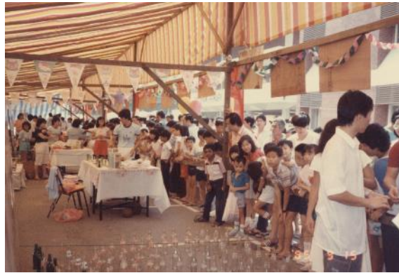
市镇会和居民委员会联合为宏茂桥居民举办嘉年华，1986年