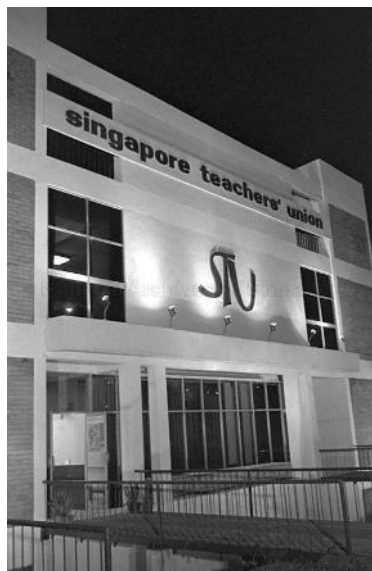
新加坡教师工会也设在新落成的教师中心内，1975年