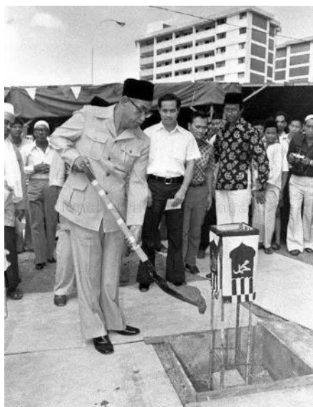
阿沙戈夫为阿尔慕达金回教堂主持动土仪式，1979年

如今，坐落在市镇中心入口的阿尔慕达金回教堂，为宏茂桥回教居民的宗教需要与生活提供指导和支持，成为区内回教社群的聚集地，也是为人所知的地标建筑。