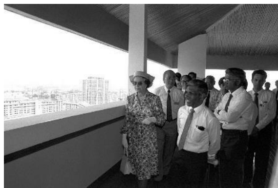
英女王伊丽莎白二世参访宏茂桥的第710座组屋，1989年