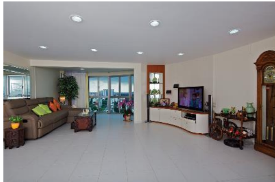
第259座组屋的内部弧形设计，年份不详