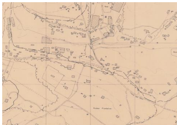
地图显示了现今的实龙岗花园附近的静山路一带，1970年

如今，访客仍可在公园内看到甘榜时代的橡胶树和果树。步道旁也有橡胶种子雕塑，以纪念这一带曾是橡胶园的历史。