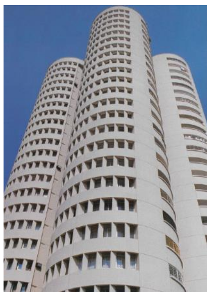
第259座组屋刚推出时的面貌，1981年