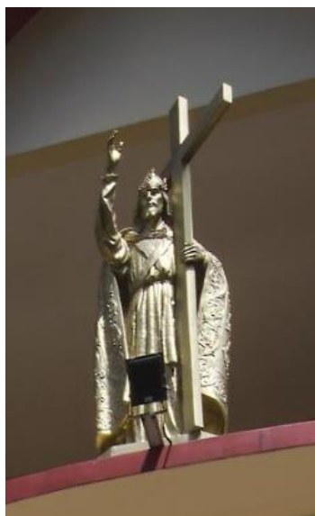
教堂正面的耶稣君王雕像，2023年