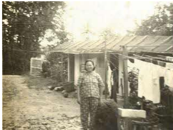
静山村民站在家门前留影，年份不详