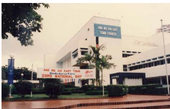
宏茂桥东市镇会办事处，1988年

试点项目取得成功后，国会在1988年通过《市镇理事会法令》。如今，市镇会在组屋区的管理上发挥着重要作用。