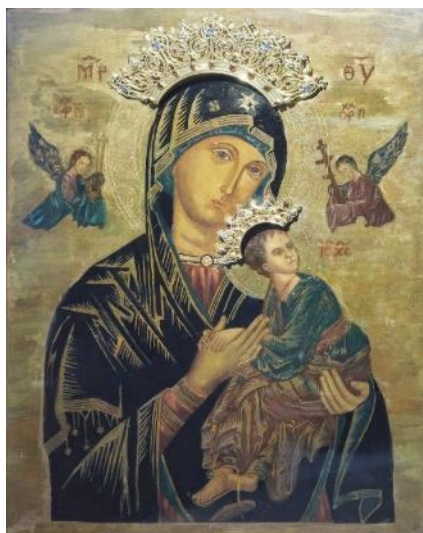
教堂圣殿内的永援圣母像，2023年