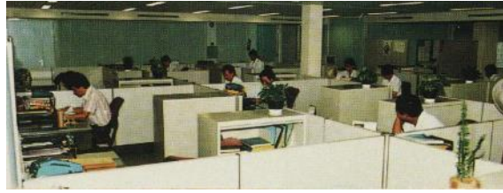
职员在宏茂桥东市镇会办事处工作，1989年