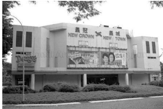
皇冠和皇城戏院，1984年