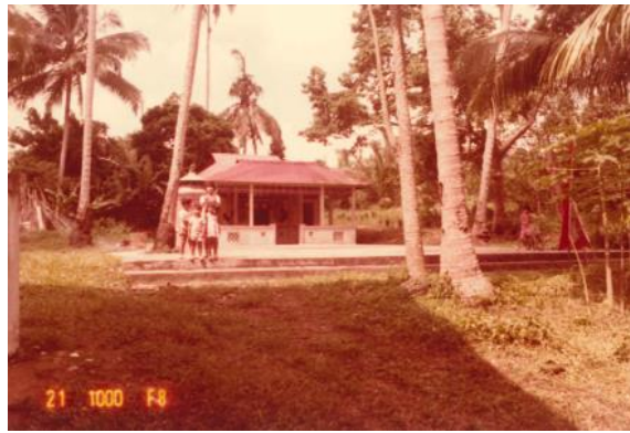
六巡村的三安府原貌及其周围环境，年份不详